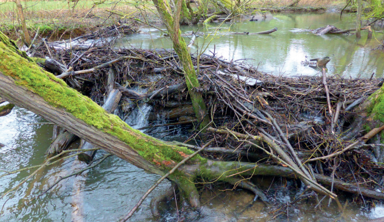
Staudamm am Simmerbach

Dank uns Biber sind viele Arten zurückgekehrt